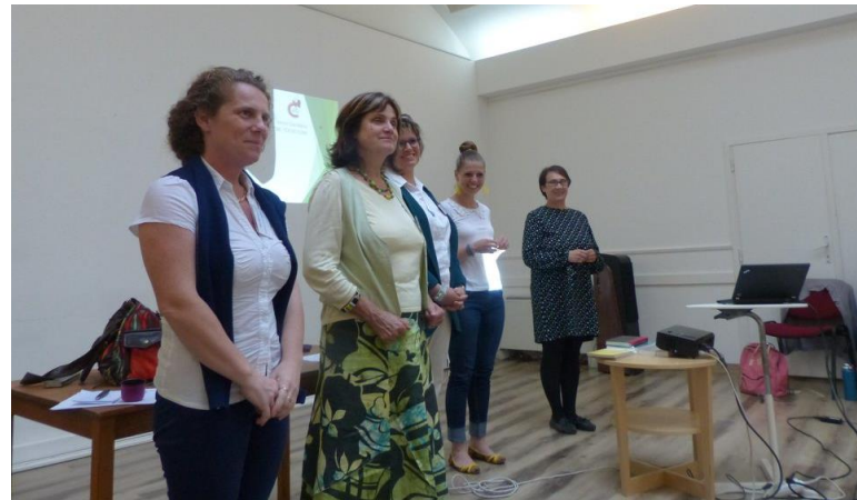
Oklevél átadás az előadóknak a konferencián

2014-ben iskolájukat örökös ökoiskolává nyilvánították. Nem csak az oktatásban, de az iskola működésében is környezettudatos elveket alkalmaznak. Ennek példái a fenntarthatósággal kapcsolatos témakörök feldolgozása az iskolában, tanórán kívüli tevékenységek és szabadidős programok, vagy a részvétel a „Te szedd!” takarítási akciókban. Minden évben megrendezik a fenntarthatósági témahetet. Erdei iskolát szerveznek és iskolakertet tartanak fenn. A tapasztalaton alapuló tanulás, a témák újszerű feldolgozása, a tanulási környezet megváltoztatása erős motivációt jelent a diákoknak az ismeretszerzésben.