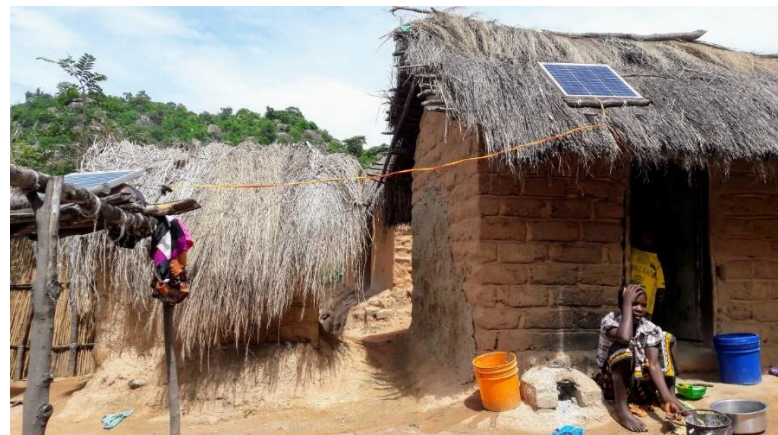
Napelemek egy afrikai nyomornegyedben

Ennek az elképzelésnek a megvalósulására láthatunk példát a dél-afrikai Kimberlyben, ahol egy magánvállalkozó a helyi szegényekkel arra szövetkezett, hogy a nyomornegyed helyén egy 200 család részére alkalmas „napfalut” hozzanak létre. Az ottanonok energiaszükségletét napenergiából fedezik: ugyanis a telkeket hatosával összekapcsolt napkemencék látják el energiával. A területen a hulladék újrahasznosítása is többnyire megoldott, ugyanis a helyben komposztált háztartási szerves hulladékkal a kerteket trágyázzák. Az öntözés szűrt szennyvízzel történik, így a lakóknak lehetősége van élelmiszer termelésére saját szükségleteik kielégítése érdekében. Az érintett otthonok építési költsége pedig nem haladja meg az állam által az első otthonot vásárlóknak juttatott kedvezmény összegét. (O’Meara, M. 1999)