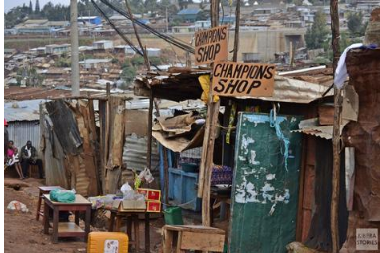
Ételárusító üzlet Kiberában

Ám a vállalkozás indításához szinte elengedhetetlen a megtakarítás és a hitel. (Perlman, J. E., O'Meara Sheehan, M. 2007) De az emberek csak akkor juthatnak banki kölcsönhöz, ha egyrészt igazolni tudják fizetőképességüket (O'Meara Sheehan, M. 2003), másrészt bejelentett lakhellyel rendelkeznek. Előbbi probléma kiküszöbölésére számos alulról jövő kezdeményezést jött létre világszerte, amik sikerrel jártak.