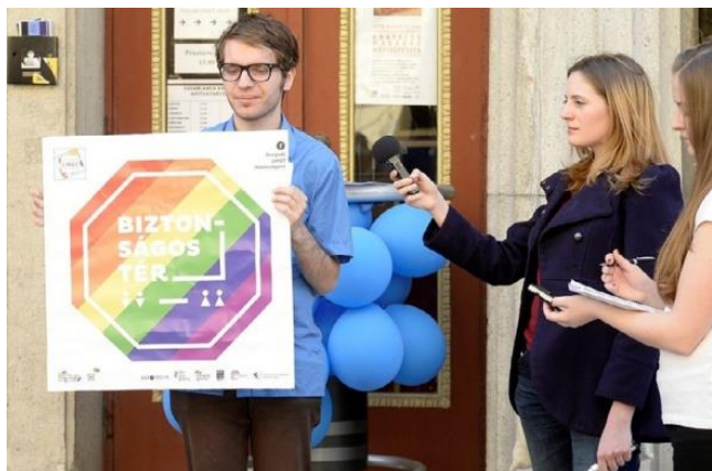
Beszédet mond a Szegedi LMBT Közösségért Csoport egy tagja.

Szeged történetében először, 2016. április 4–10. között szerveztük meg a Szivárvány-hét nevű akcióhetet, amely alatt kilenc szegedi üzlet és közösségi tér helyezte ki ajtajára a biztonságos teret jelölő matricát, hogy közösen lépjenek fel az LMBTQI-embereket (leszbikus, meleg, biszexuális, transznemű, queer, interszex) érő megkülönböztetés ellen. Erre az erős kiállásra azért is volt szükség, mert több nyilvános helyen érte diszkrimináció, illetve bántalmazás a melegeket. Az akcióhét megnyitóján többek között Jávorszky Iván, a Belvárosi Mozit, az IH Rendezvényközpontot is működtető cég és egyben a Szegedi Városi Televízió ügyvezető igaz- gatója mondott beszédet. A Szivárvány-hetet követően az ország különböző pontjairól több vendéglátóhely is megkereste a csoportot, hogy küldjön számukra matricákat, jelezve, hogy más településekről is csatlakoznának a kampányhoz.