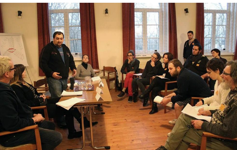
Közösségi vezetőképzés.

a közösségi alapú szervezőmunka különböző szinteken és volumenekben zajló gyakorlatáról, szereplőről, tematikáiról, módszereiről, különös tekintettel a kisebbségekhez kapcsolódó érdekvédelmi jellegű közösségi munkára. A program további elemeiben amerikai mentorok érkeztek Magyarországra (és három további európai országba), akik több száz hazai kezdeményezéssel kerültek kapcsolatba. A programba öt OSIFE támogatottnak is sikerült bekapcsolódnia, illetve, ahogy fentebb már írtuk, az amerikai közösségszervező mentorok képzési és konzultációs szakmai támogatást nyújtottak közösségszervezőinknek, évente legalább két alkalommal (beszélgetéseket, műhelyeket, képzéseket, előadásokat tartva szerte az országban), ezzel segítve munkájukat.