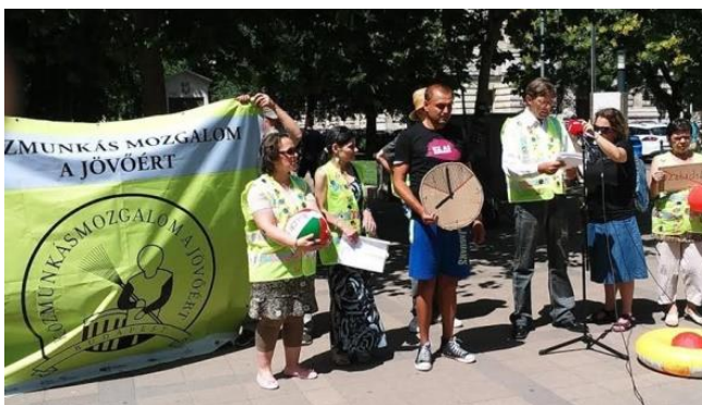
A KMJ akcióban.

„Minden munkahelyen vannak olyanok, akik úgy gondolják, hogy jobb helyzetbe kerülhetnek attól, ha a munkatársaikra terhelő információt adnak a vezetőnek. A közmunkában nem látom, hogy mi lehet ez az előny, talán az, hogy a munkavezető elnézőbb lesz velük, lezserebben vehetik a munkát, de a fizetése senkinek nem lesz több. Amikor beszélgetek valakivel, nem csak arra kell figyelni, hogy a vezető ott van-e, hanem arra is, hogy milyen munkatárs áll éppen a közmunkás mellett. Mint a szocializmusban: megy a megfélemlítés, működik a besúgó rendszer, a belügyminisztériumtól a közmunkásig az egész rendszer a megfélemlítésen alapul.”