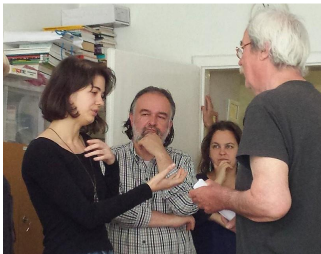
Képzők képzője.

A program fentebb ismertetett alapszintű szakmai támogatása mellett számos egyéb segítség igénybevételére teremtettünk lehetőséget.