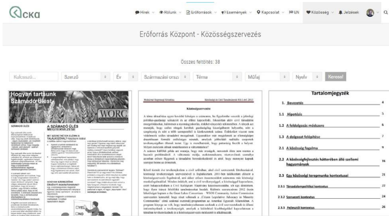
Erőforrás Központ.

A közösségszervezés – dióhéjban – a kapcsolatok szervezésének, az ügyek azonosításának, a meghatározott ügyek körüli mozgósításnak és egy hosszú életű demokratikus szervezet felépítésének a folyamata, ahol a győzelem legalább olyan fontos, mint a szervezetépítés. A közösség ebben a tekintetben tehát nem elsősorban személyes kapcsolatokon alapuló, támogató társaságot, hanem emberek olyan érdekközösségét jelenti, akik az érdekeik döntéshozókkal szembeni érvényesítése közben a (helyi) közélet szereplőivé válnak. A közösségszervező pedig az a szakember, aki ilyen csoportok megalakulását segíti vagy létezésüket támogatja. Ahogy az első fejezetben bemutatott példák is mutatták, ez egy ciklikus, organikus folyamat.