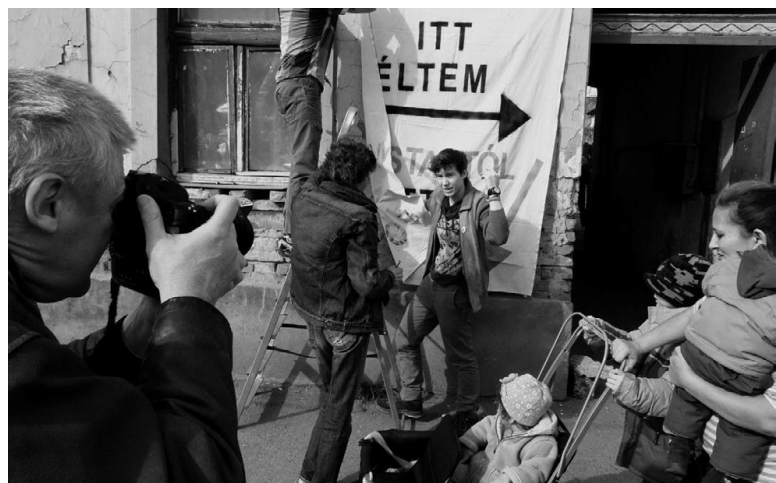
Az AVM Pécs akcióban.

„A hajléktalan emberek kriminalizálása mellett még két fő helyi problémát vázoltunk fel közösen, a város nem megfelelő szociális bérlakás állományából fakadó áldatlan lakáshelyzetet és a hajléktalan ellátórendszer hiányosságait. A három fő feladatot megpróbáltuk munkacsoportba sorolni, de ez még nyolc fővel nem sikerült, ezért egy negyedik fontos feladatot is besoroltunk, a toborzást.”