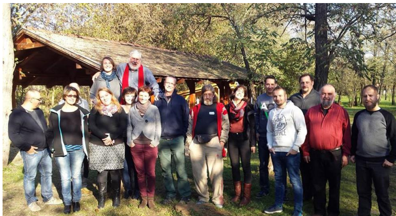
Haladó képzés.

A cka.hu online közösségi platform is lehetőséget teremt a hatékonyabb kommunikációhoz és a csoportmunkához, továbbá az oldalon a közelmúltban indított Közösségszervező Erőforrás Központ egyre gazdagabb hazai segédanyagokkal szolgál a közösségszervezők önálló felkészüléséhez (cikkek, módszerek, esettanulmányok, filmek stb.).