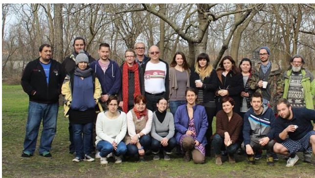
Közösségi vezetőképzés.