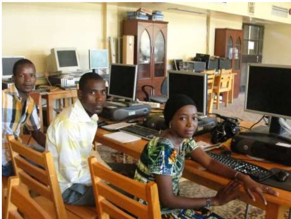
Az egyetem vezetősége ugyan ingyen a rendelkezésünkre bocsátotta a számítógépes termet, azonban az áramkimaradásokkal szemben ők is tehetetlenek voltak

A közös munka tehát mindenképpen eredményes volt, még ha a körülmények néha nem is voltak egyszerűek. Volt, hogy a számítógépes terem elárasztotta az eső, máskor órákat töltöttünk internetre várva, majd mikorra végre sikerült beüzemelnünk, addigra elment az áram. A kulturális különbségeket próbáltuk megfejteni, önmagunkból csapatot kovácsolni, az egyetemen maradandót alkotni, mely a következő generációknak is a hasznára válik majd. Nem kevés fejtörést igényelt ugyan ez a folyamat, de úgy gondolom, mindannyian rengeteget tanultunk egymástól és egymásról, nem is beszélve önmagunkról.