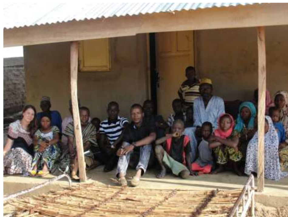
Massama térképészekor, mely előtte egyáltalán nem szerepelt a térképen, az egyik diák családjánál laktunk az adatfelvétel idején

Így hát alkalmazkodtunk. A tíz alkalmas képzésből, a diákok kezdeményezésére, született a hathónapos, heti több napot felölelő közös műhelymunka, melynek során mindenki elsajátította a GPS-es adatfelvételt, az OSM használatát, a blogolás alapjait és a Facebook használatát. Magával ragadó cikkek és fényképek születtek így, melyek közül sok a Global Voices főoldalára is kikerült. A nyári szünetet pedig sikerült a saját javunkra fordítani: öt diákom a vakációt a GPS-szel a kezében töltötte, és szorgalmasan gyűjtötte az adatokat az otthonáról. Cserébe kisebb mértékű ösztöndíjat kaptak, mely a hazajutásuk költségeit, illetve a helyi közlekedést és kommunikációt fedezte. Így fejlődött jelentős mértékben Zinder, Madaoua és Gaya térképe. Eközben mi Niameyben folytattuk a munkát a többiekkel, és elkészítettük az egyetem térképét, köszönetképpen a földrajz tanszéknek, valamint egy örökre emlékezetes, adatfelvétellel egybekötött kirándulást szerveztünk egy a nigériai határ mentén fekvő kis faluba, ahonnan az egyik résztvevő diák származott. A faluban a családja látott minket vendégül, napközben pedig a környék gyerekei kísérték minket körbe. Massama és Dosso így került fel a térképre.