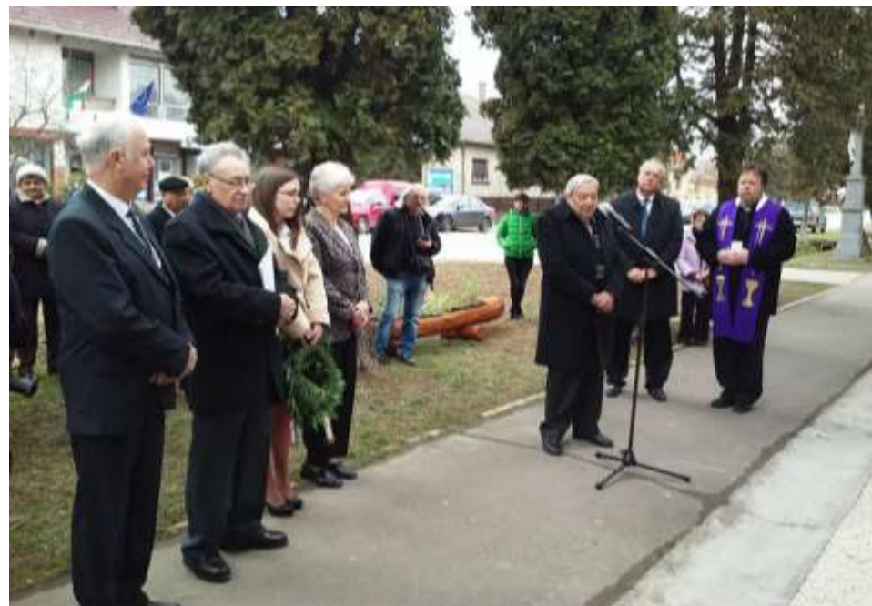
Zalaszentlászló, Faluház ünnep