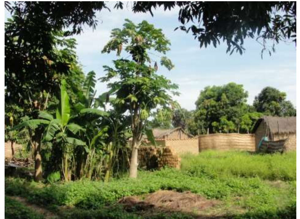
Goréba, Csád déli részén fekvő kis faluba a környezet menekülttáborok térképezése kapcsán kerültem 2012 végén

A térképészeti projektekre a régióknak, a koordináción túlmenően is nagy szüksége van. Sok ország egyáltalán nem rendelkezik naprakész térképpel,