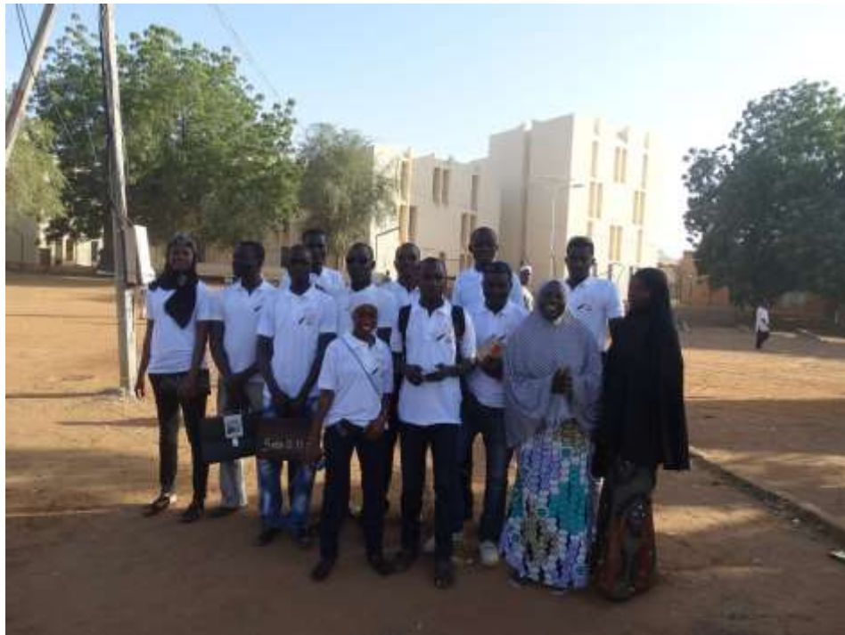
A diákok folytatták szaktársaik képzését. Ezen a képen épp az egyetem egyik épülete előtt gyülekeznek, hogy a negyedben adatfelvételre induljanak.

kapcsolatot ápolnak, gyakornokoskodnak, kutatásokban vesznek részt, nap mint nap dolgoznak a térképen, ötletekben és tervekben tobzódnak. Csak állok és ámulok, hogy 3000 dollárral, hat hónap alatt, némi energia és fejtörés árán milyen messzire lehet jutni.