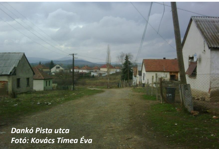
Dankó Pista utca

Másodikként az út leaszfaltozásának kiharcolása került sorra, ami mellett több érv szólt: a szemétszállító sem szívesen hajtott be esős időben az utca emelkedőjére, a kicsiket pedig szüleik szerint gyakran bántották iskolában, óvodában, amiért sárosan érkeztek. Ebben az ügyben a fő szerepet az utcán élő közmunkások töltötték be. Kampányt indítottak, melynek fő érve, hogy az aszfaltozási munkát elvégzik, a közmunkaprogramban van elég nyersanyag, a Dankó Pista út pedig az egyetlen olyan belterület, amelynek nincs burkolata. Elsőként brigádvezetőjüket nyerték meg szövetség-