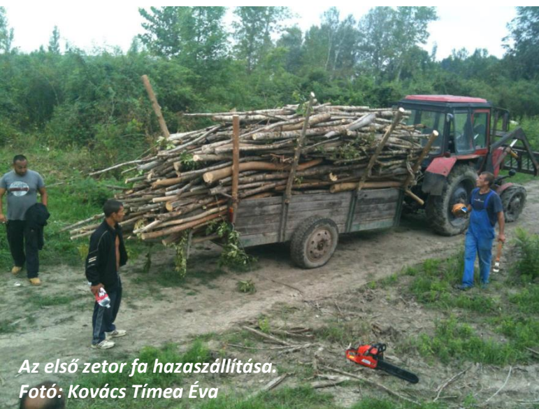
Az első zeter fa hazaszállítása.

Az internet és a számítógép kulcsfontosságú, mert kinyitja a világot. Meséket néznének a kicsik, táncolnának, zenélnének, buliznának a nagyok. A fiúk edzőteremről álmodnak, az idősebbek a roma kultúrát ápolnák, romanit tanulnának. Van, aki tetoválna, graffitizne, van, aki haját vágna - a név is részben innen ered.