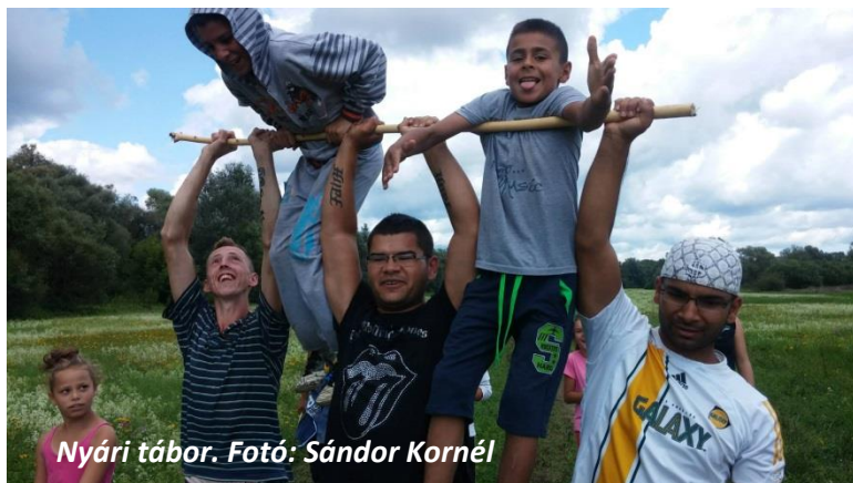
Nyári tábor.

Legalább akkora álomnak tűnik a Birkanyíró ma, mint 2013-ban az aszfalt, a szociális tüzelő, az új kisebbségi elnök vagy a nyári tábor. De mára megtapasztaltuk már, hogy vannak álmok, amelyek hétköznapi hősök kitartó munkájával valóra válnak, még Olaszliszkán is.